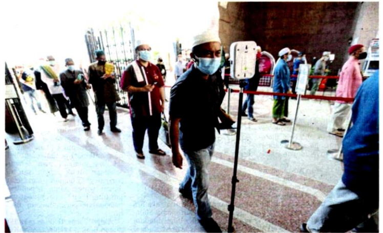
Jemaah melakukan pemeriksaan suhu badan sebelum memasuki Masjid Putra, Putrajaya untuk menunaikan solat Jumaat, semalam.

Mohd Ajib berkata, bilangan jemaah solat Jumaat bagi tujuh