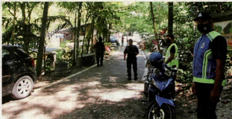
Authorities monitoring the entrance to Sungai Pisang. No visitors are allowed at the moment as the river lies within the Gombak Forest Reserve.