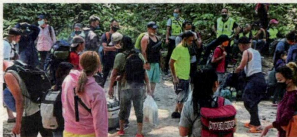
Authorities telling visitors at Sungai Pisang in Gombak to pack up and leave.