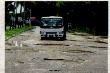
Heavy vehicles use Jalan Sungai Kapar Indah daily.

"I see many motorists trying to avoid the potholes and driving at an extremely slow pace to avoid damaging their cars, but this itself causes the risk of an accident with vehicles behind them," he said.