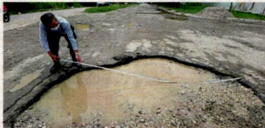
Mok showing the width of one of the large potholes in Jalan Sungai Kapar Indah, which measures between 3.2m and 4.1m.

"I dread going on that stretch of the road.