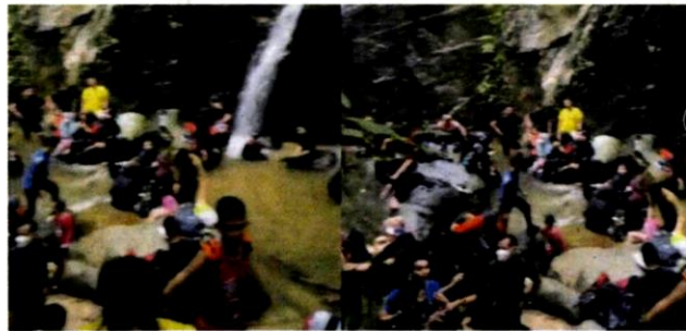
Sejak seminggu lalu tular video dipercayai di kawasan Air Terjun Sungai Pisang di Ulu Gombak sesak dengan kehadiran orang ramai.

Menurutnya, pematuhan terhadap SOP ditetapkan Majlis Keselamatan Negara (MKN) perlu diutamakan ketika berada di kawasan rekreasi yang dibenarkan dalam tempoh Fasa 2 PPN di negeri berkenaan.