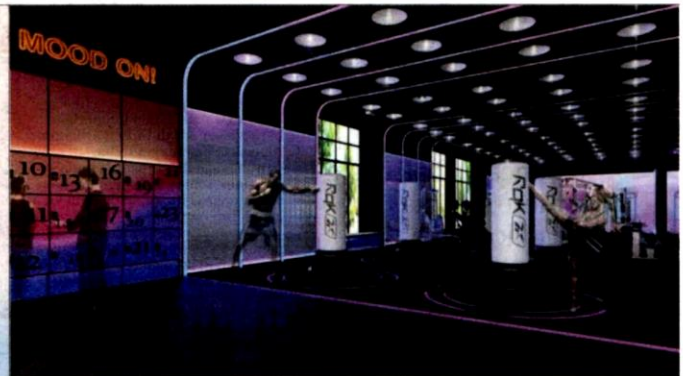
▲ Dewan serba guna dan Smart Gym.

Hanya 150 meter berjalan kaki dari Stesen LRT Jelatek dengan