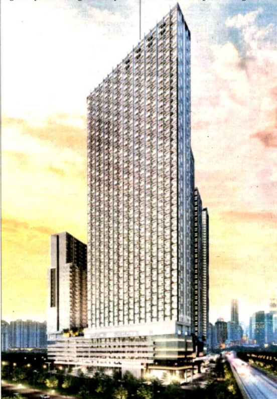
▲ Astrum Ampang, pembangunan bercampur dilancarkan Setia Awan Group.

Astrum Ampang juga antaranya dilengkapi jakuzi, gelanggang tenis dan bilik refleksiologi. Dengan 27 unit komersial yang melayani penduduk pembangunan itu dan penduduk lain di kawasan bandar, elemen itu dirancang untuk memberi penduduk gaya hidup bandar yang lebih menarik.